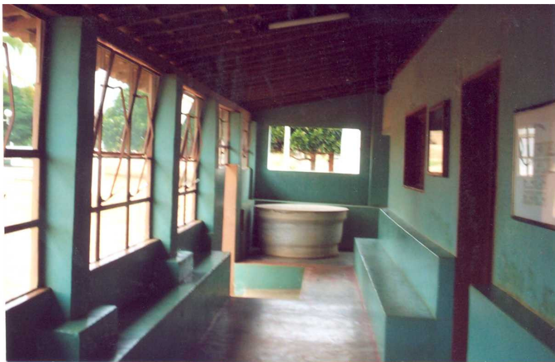
Foto 9: Varanda do "Palácio", lugar onde muitos esperavam para falar com "Meu Rei".