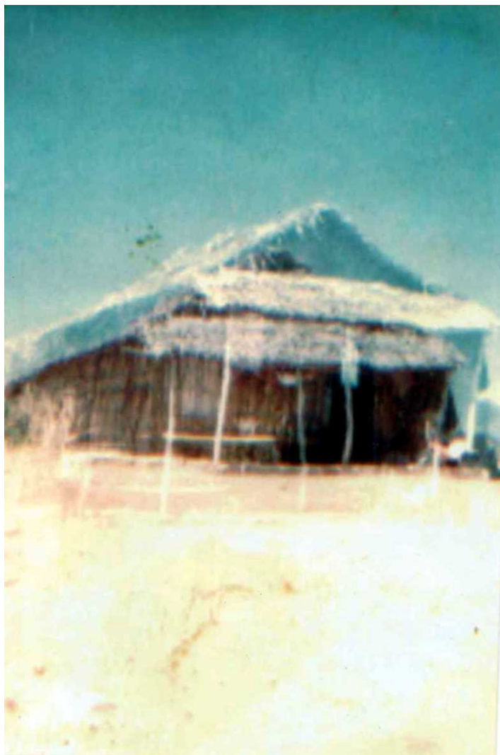
Foto 3: Rancho de palha, construído em 1976 pelos primeiros seguidores de “Meu Rei”. Ele e seus primeiros seguidores passaram três anos acampados, até construírem as primeiras casas de alvenaria.