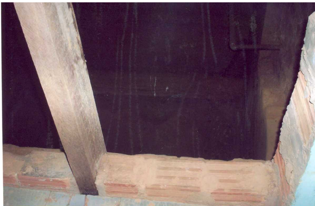
Foto 10: Uma das tantas cisternas, nos subterrâneos do "Palácio", em que era armazenada a "água da vida" ou "água abstratosa".