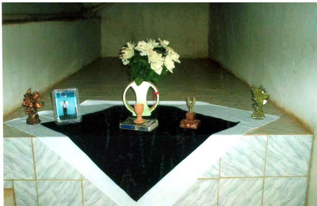
Foto 13: Mausoléu de Cícero, construído em 1999, aproveitando-se do espaço ocupado por uma das cisternas subterrâneas.