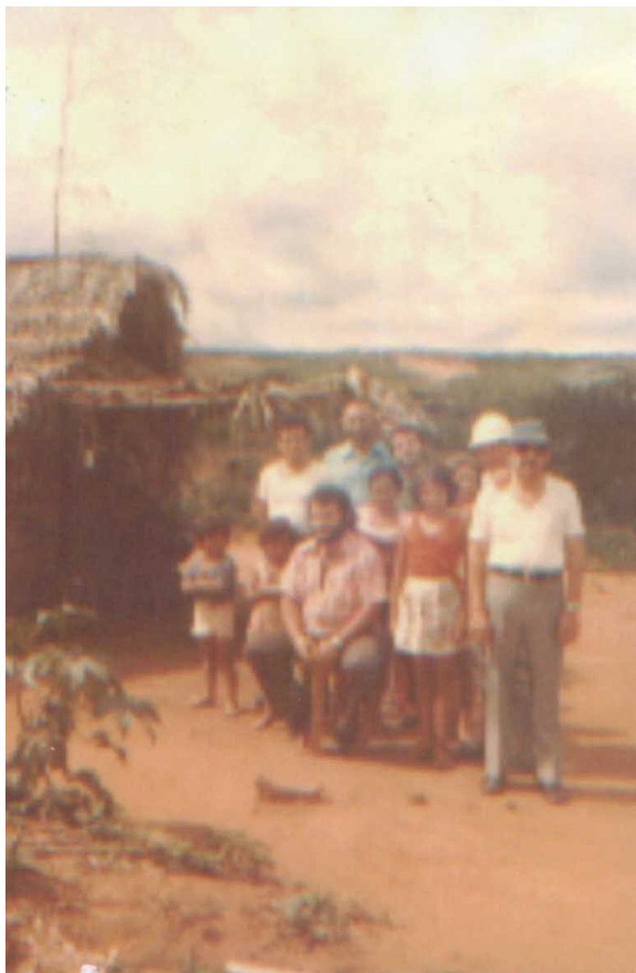
Foto 4: Primeiros seguidores de Cícero, no final da década de setenta.