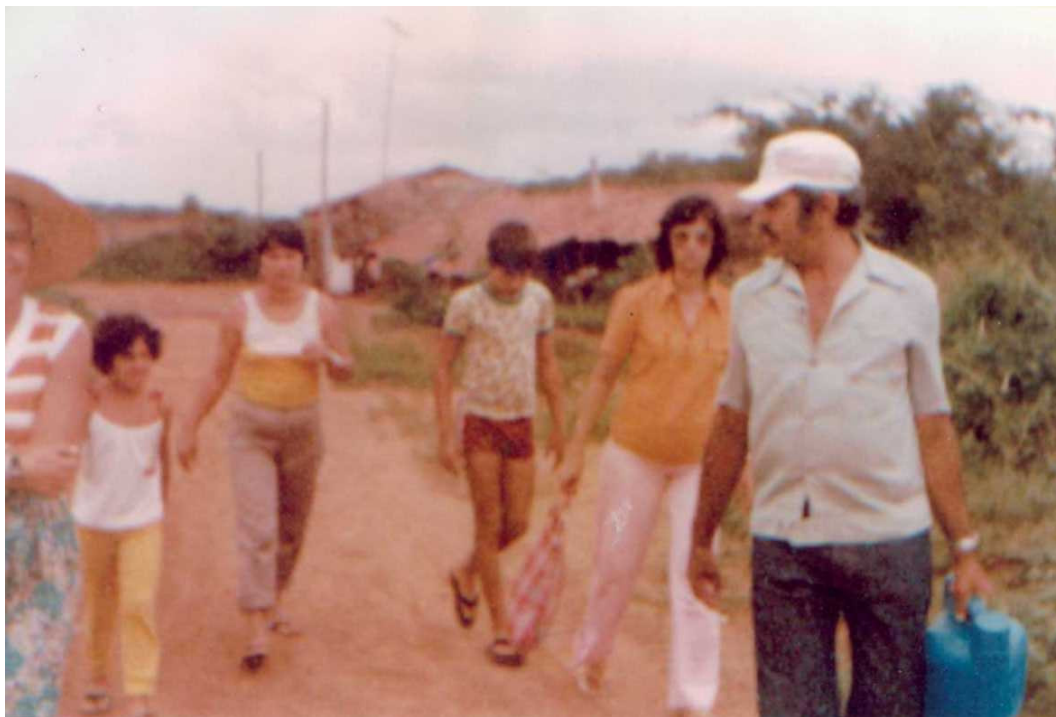
Foto 5: Os seguidores de Cícero na década de oitenta, ao fundo as primeiras construções de alvenaria.