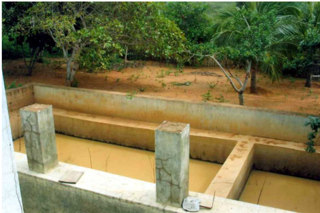
Foto 11: Cisternas construídas ao redor do "Palácio", para armazenar a água de uso diário.