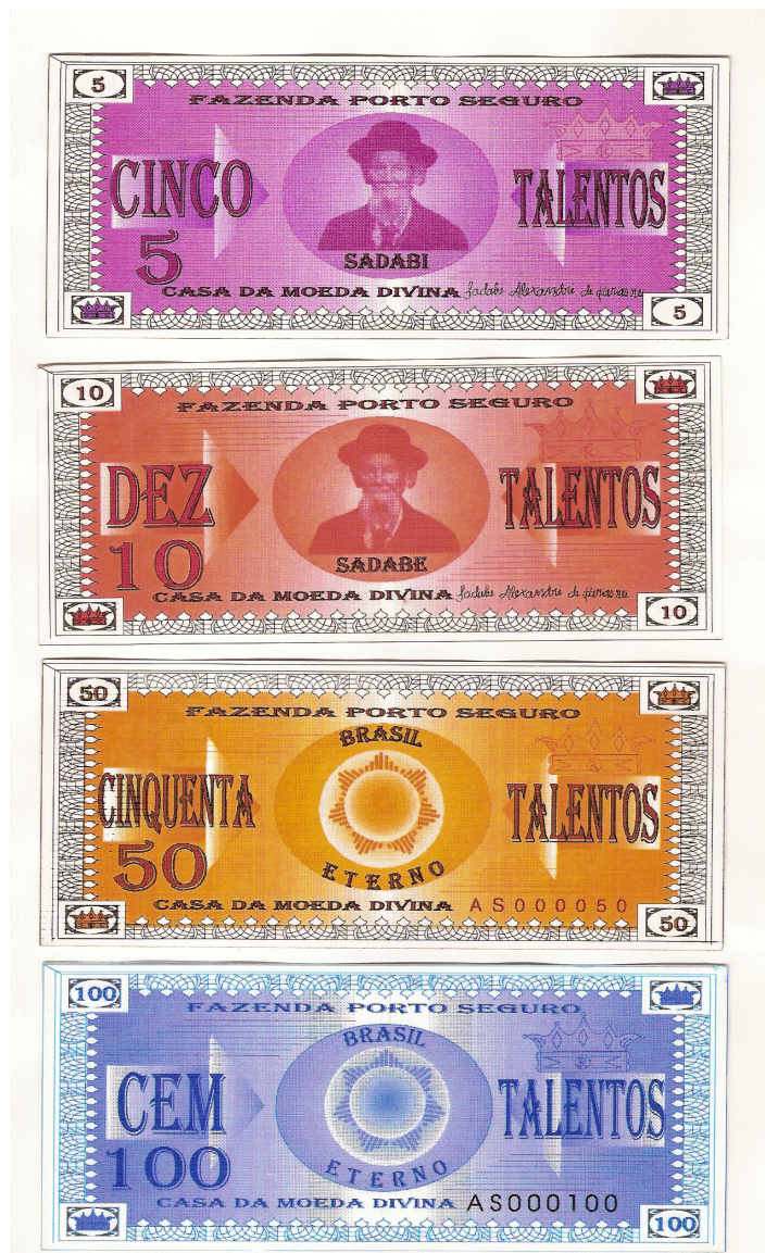
Foto 15: Cédulas do dinheiro da comunidade, chamado com o nome bíblico de Talento.