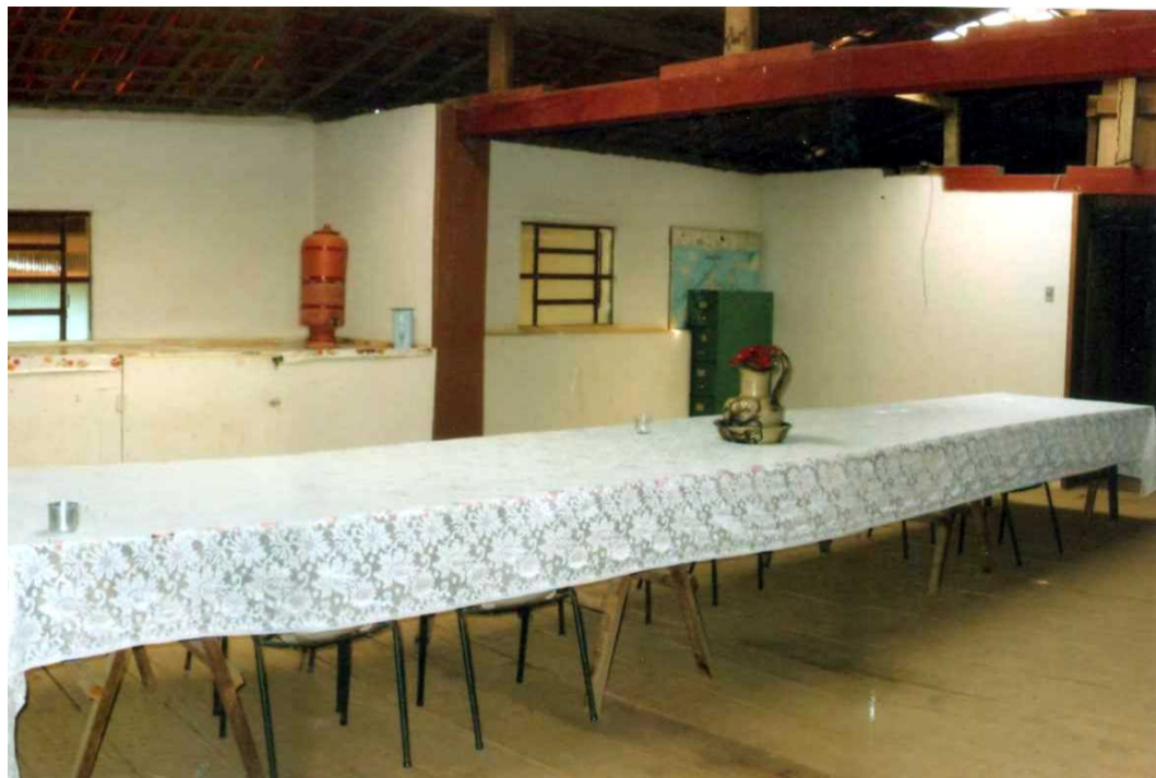
Foto 16. Mesa em torno da qual, aos domingos, aconteciam as reuniões, nos primeiros anos da Comunidade.