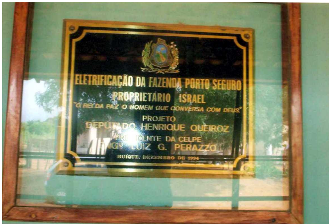
Foto 12: Placa afixada no "Palácio", em 1994, por ocasião da inauguração do fornecimento de eletricidade à Comunidade, conseguido por intermédio do Deputado Henrique Queiroz.