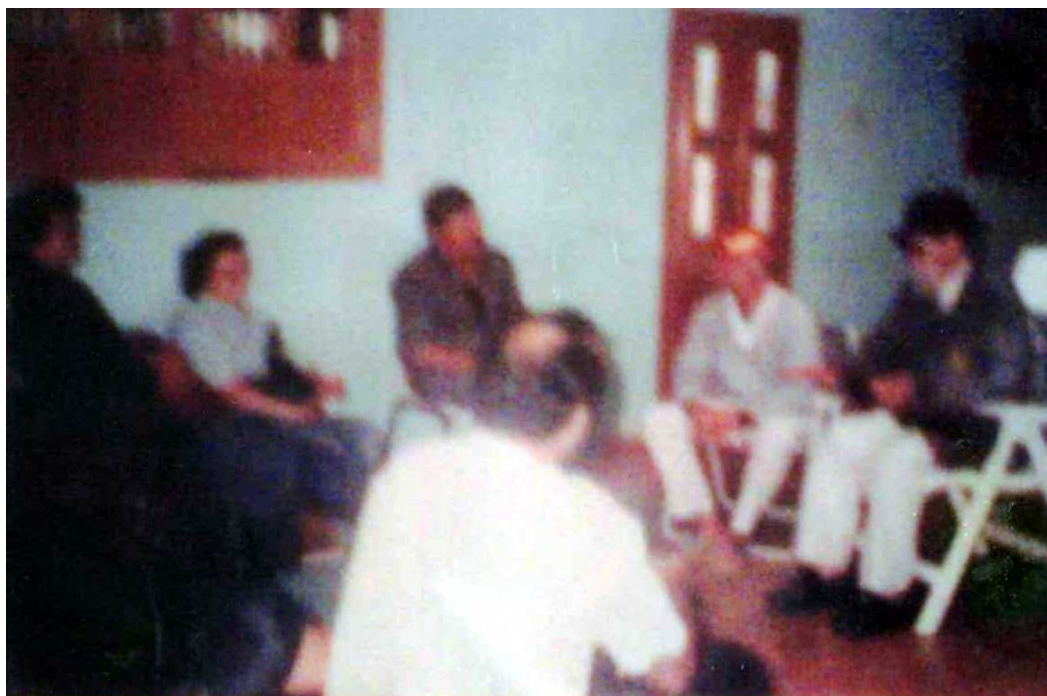
Foto 17: Uma das tantas reuniões de formação que aconteciam no "Palácio de Deus".