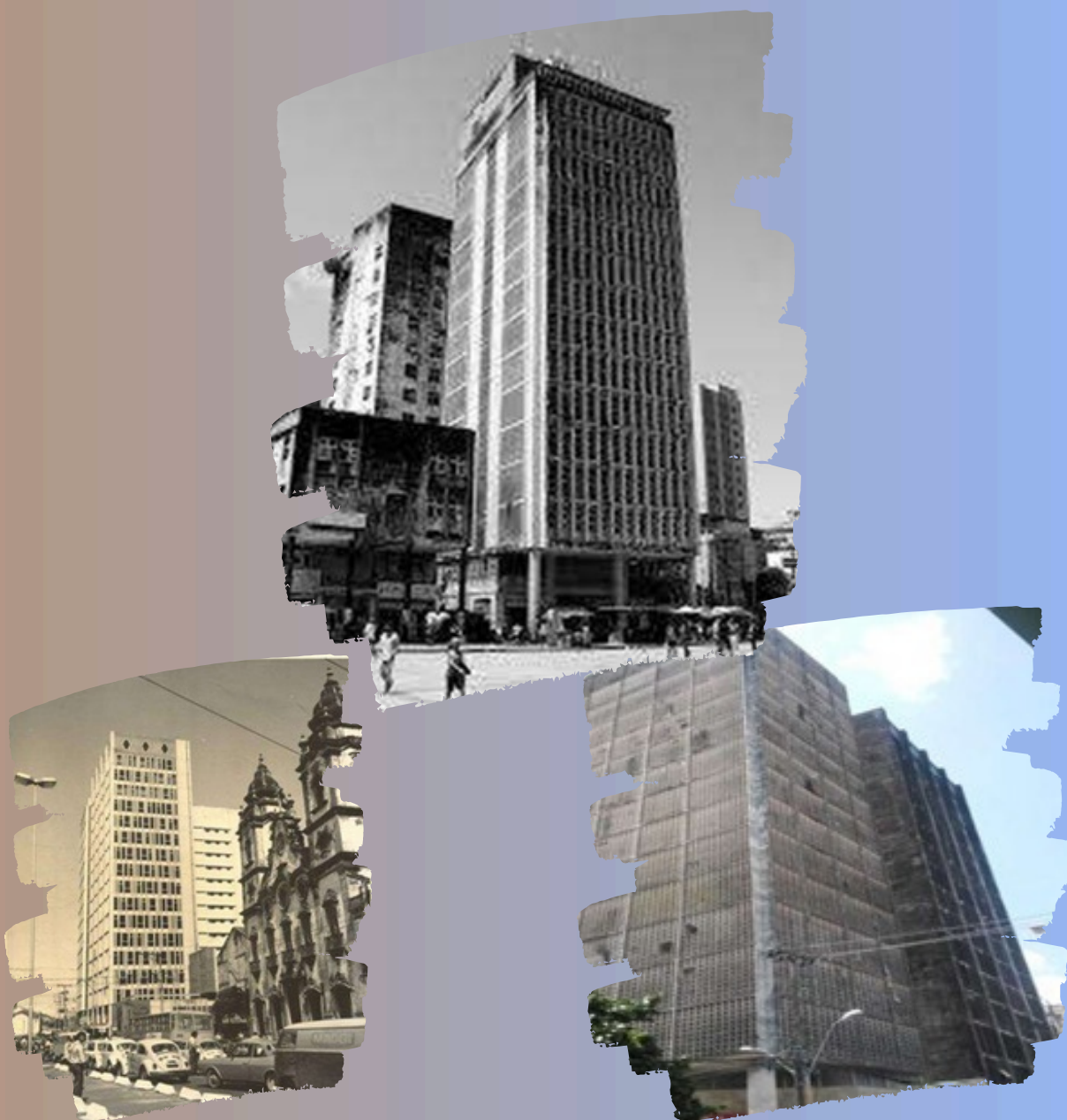
Fonte: Edif. Igarassu, construído em 1953 (à cima); Banco Mercantil, em 1964 (à esquerda) e o Edif. Sede Banco Lavoura de Minas Gerais, 1954 (à direita). https://arquimuseus.arq.br/

A construção do segundo trecho da Av. Dantas Barreto em Recife-Pe, juntamente com a abertura da Av. Guararapes, atraiu a especulação imobiliária, na qual lucrou com a valorização da área por causa dos arranha-céus como tipo ideal de construção arquitetônica.