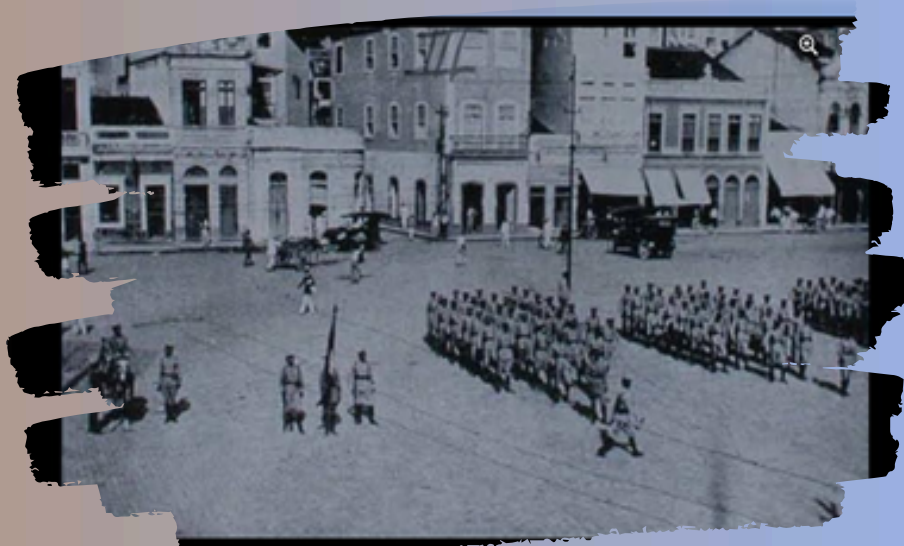
Fonte: Pátio do paraíso e o quartel da artilharia, século XIX. Revista de Pernambuco - outubro de 1925 - sem autoria da foto.

A Igreja do Paraíso, construída em 1686, foi demolida pela segunda vez para dar lugar ao Edifício Santo Albino, na esquina da Avenida Dantas Barreto com a Avenida Guararapes, em 1943.