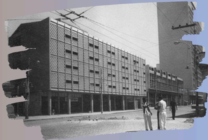
Fonte: Edifícios Santo Antônio e São Francisco antes da reforma, em 1970. Borsoi Arquitetos Associados.