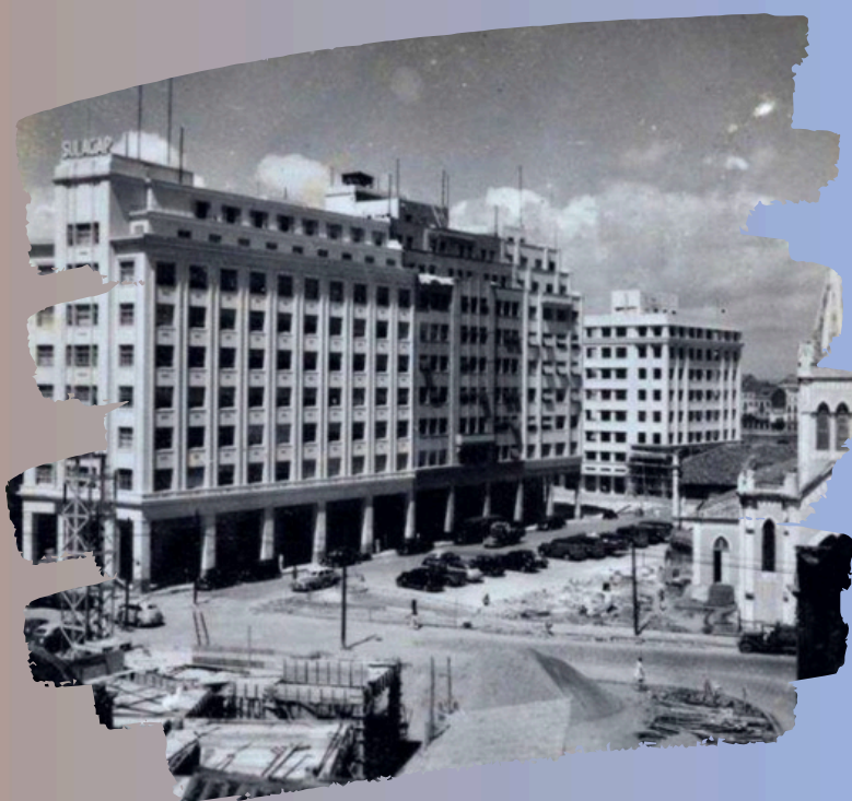
Fonte: Pátio do Paraíso/Praça Barão de Lucena. À direita, a Igreja do Paraíso, demolida para dar lugar ao Edf Santo Albino. Ao fundo, o Edf Sulacap e Igreja de Santo Antônio. Década de 1940. Alexandre Berzin. Contribuição de Elpídio Araújo.

Ressalte-se que durante a construção da Avenida Dantas Barreto em Recife-Pe, o Pátio do Paraíso e o Hospital São João de Deus com sua “Academia do Paraíso”, além do Quartel do Regimento de Artilharia, foram todos demolidos na década de 1940.