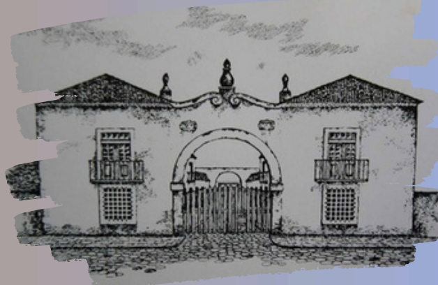
Fonte: Quartel do Regimento de Artilharia, século XIX. Editoria de Artes Jornal do Commercio na reportagem "Percorra os caminhos da Revolução no Recife" Por Marcela Balbino.