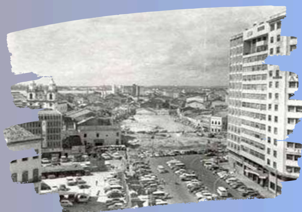
Abertura da Avenida Dantas Barreto nos anos 1970.