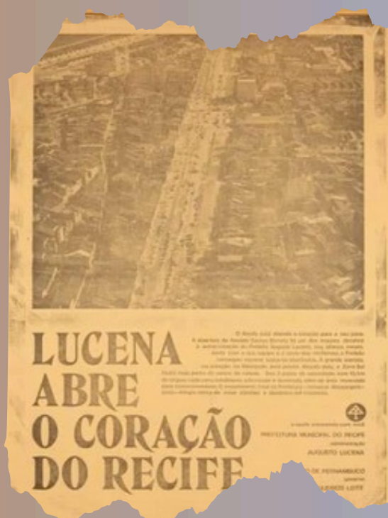
Fonte: Propaganda do governo sobre a abertura da Av. Dantas Barreto no Jornal da Manhã de 03 de Setembro de 1973.