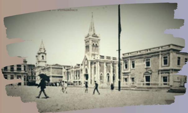
Fonte: Pátio do Paraíso, também conhecido como Praça Barão de Lucena com a Igreja do Paraíso. Aspecto do final do séc XIX/início do séc XX. Atualmente, no local da Igreja está o Edf Santo Albino, esquina das avenidas Dantas Barreto e Guararapes.