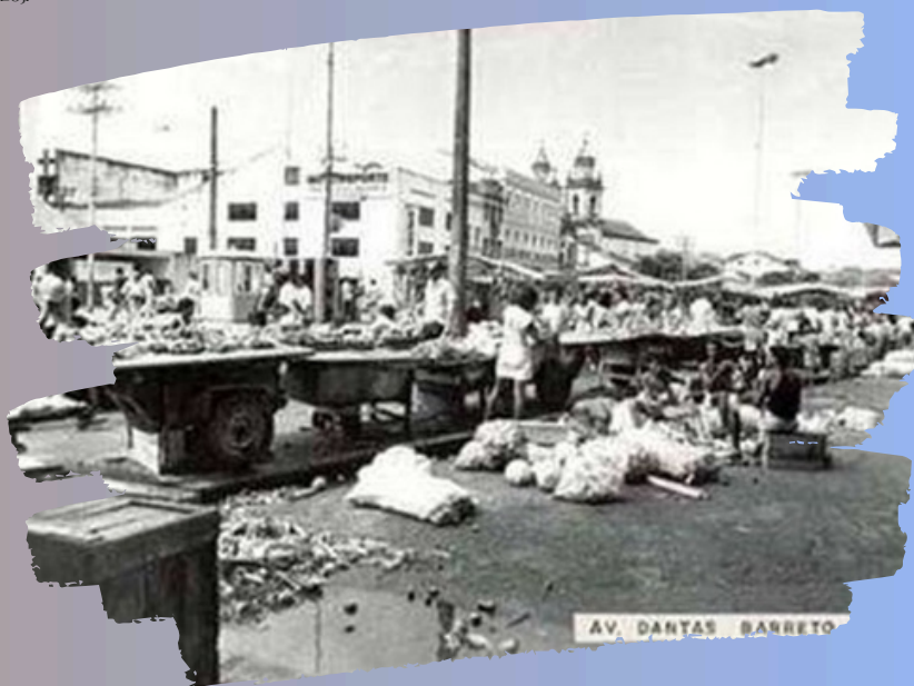
Fonte: Aspectos da utilização da Avenida Dantas Barreto por comerciantes de rua nos anos 1980. Acervo da Diretoria de Preservação do Patrimônio Cultural da Cidade do Recife.

A 3ª fase da construção da Av. Dantas Barreto em Recife-Pe, é associada as transformações dos bairros de Santo Antônio e São José como consequência da abertura da Avenida, sendo evidenciada a necessidade de refuncionalização imediata, pois envolvia a população e o comércio remanescentes.