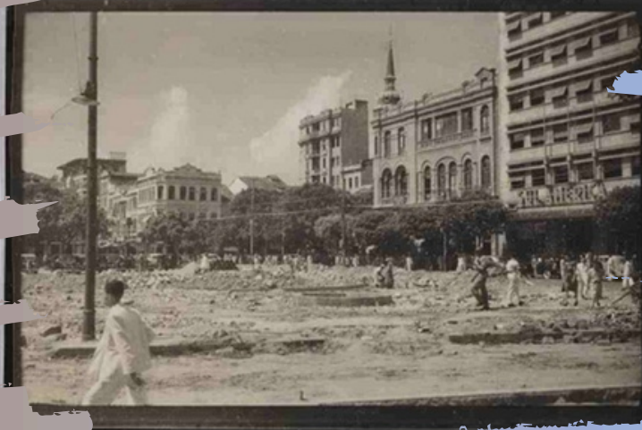
Fonte: Avenida Dantas Barreto, Recife, Pernambuco, 1945.