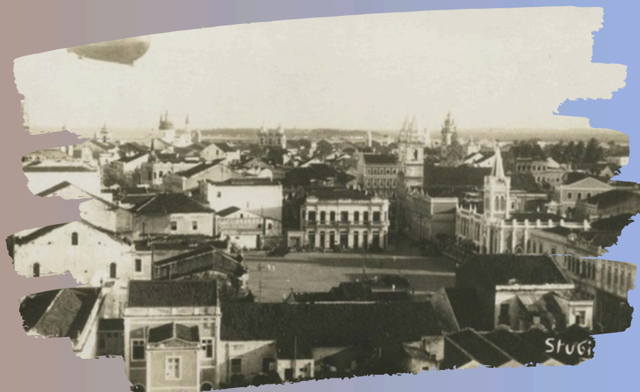
Fonte: Pátio do Paraíso no Recife, anos 1930.