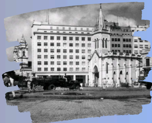
Fonte: Pátio do Paraíso/Praça Barão de Lucena. À direita, a Igreja do Paraíso, demolida para dar lugar ao Edf Santo Albino. Ao fundo, o Edf Sulacap e Igreja de Santo Antônio. Década de 1940. Fonte: Alexandre Berzin. Contribuição de Elpídio Araújo.