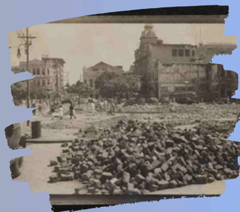
Fonte: Fotografia do bairro de Santo Antônio na construção da Av. Dantas Barreto em Ano 1945. Benício Whatley Dias. FUNDAJ/CEHIBRA. Código - BD_001397

A transformação dos bairros de Santo Antônio e São José iniciou com a ideia da construção da Avenida Dantas Barreto em 1930 durante o Estado Novo e ditadura militar, inaugurada em 1973 pelo então Prefeito Augusto Lucena.