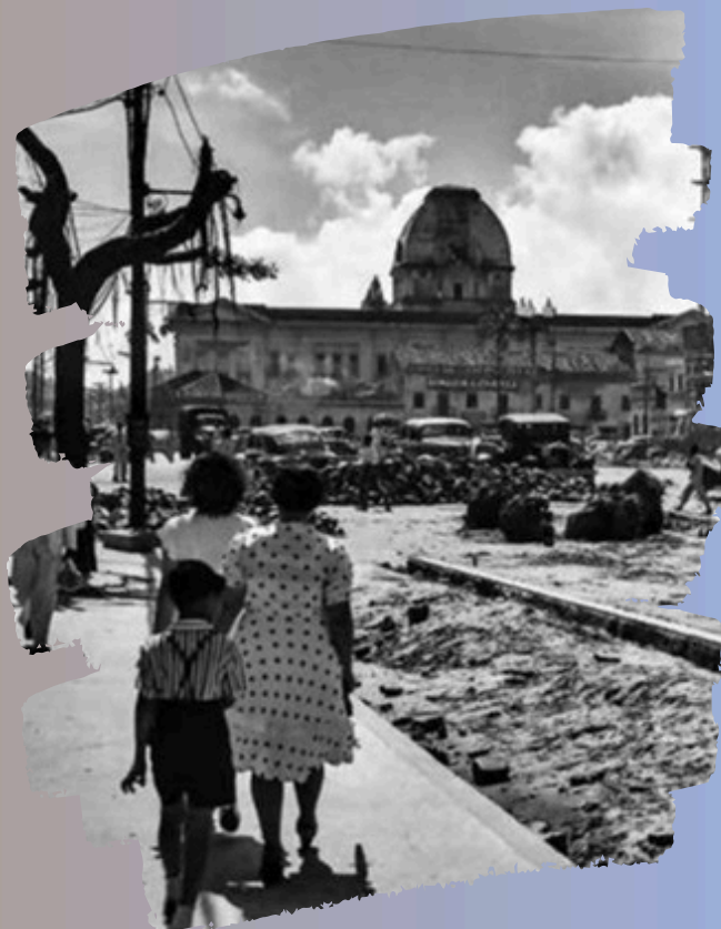
Fonte: Avenida Dantas Barreto em construção em 1946. Benício Dias, Coleção BD Negativos, Villa digital Fundaj, Ministério da Educação.