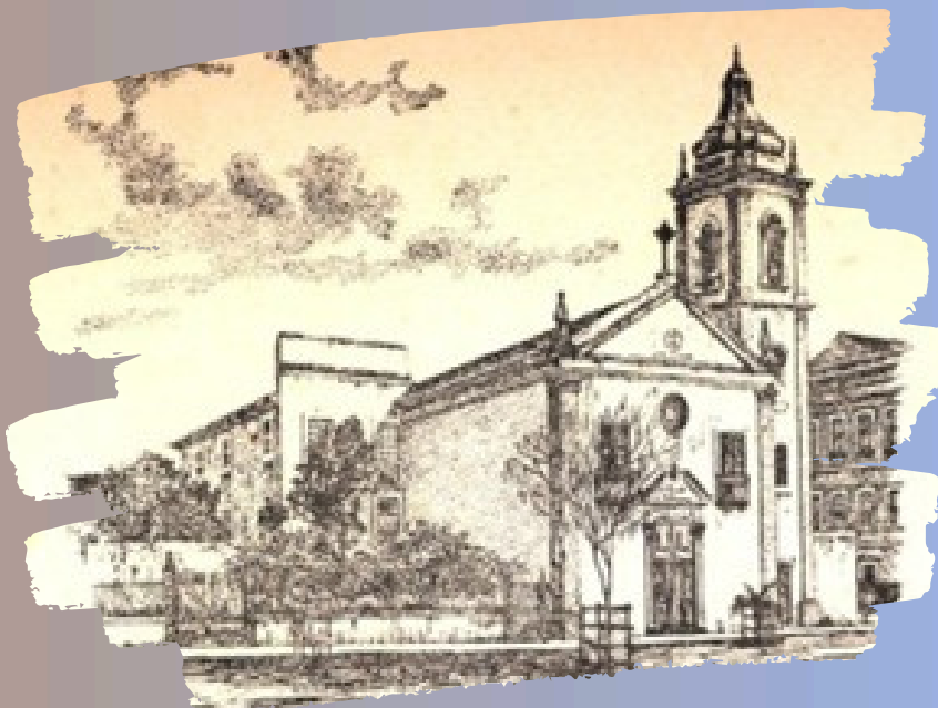
Fonte: Igreja do Paraíso no início do século XX, possivelmente em sua primeira década. Museu do Estado de Pernambuco.