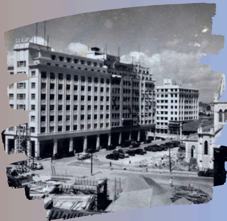
Fonte: Pátio do Paraíso/Praça Barão de Lucena. À direita, a Igreja do Paraíso, demolida para dar lugar ao Edifício Santo Albino. Ao fundo, o Edifício Sulacap e Igreja de Santo Antônio. Década de 1940. Alexandre Berzin. Contribuição de Elpídio Araújo.

A obra, que perdurou por quatro décadas, foi envolta em debates políticos, de intelectuais e de profissionais da área, envolvendo também a população.