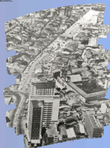
Fonte: Acervo de Alcir Lacerda. Abertura da Av. Dantas Barreto com a Igreja dos Martírios ainda de pé no meio da avenida, em 1973.

A terceira fase da construção da Av. Dantas Barreto em Recife-Pe, foi marcada pelo embate aos defensores da permanência da Igreja dos Martírios, no segundo governo de Augusto Lucena, atendendo às ideias do Estado Novo e do Regime Militar.