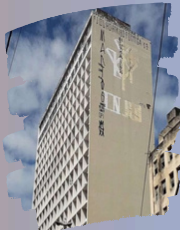
Fonte: Edif. Juscelino Kubitschek (JK) Instituto de Aposentadoria e Pensões dos Industriários (IAPI). Projeto Equipe de arquitetos do banco IAPI, 1951.

Novos patrimônios foram edificados durante a construção da Avenida Dantas Barreto, entre eles os Edifícios Santo Antônio e São Francisco, construídos em 1963, próximos ao Tribunal de Justiça e Convento de Santo Antônio e sua Capela Dourada.